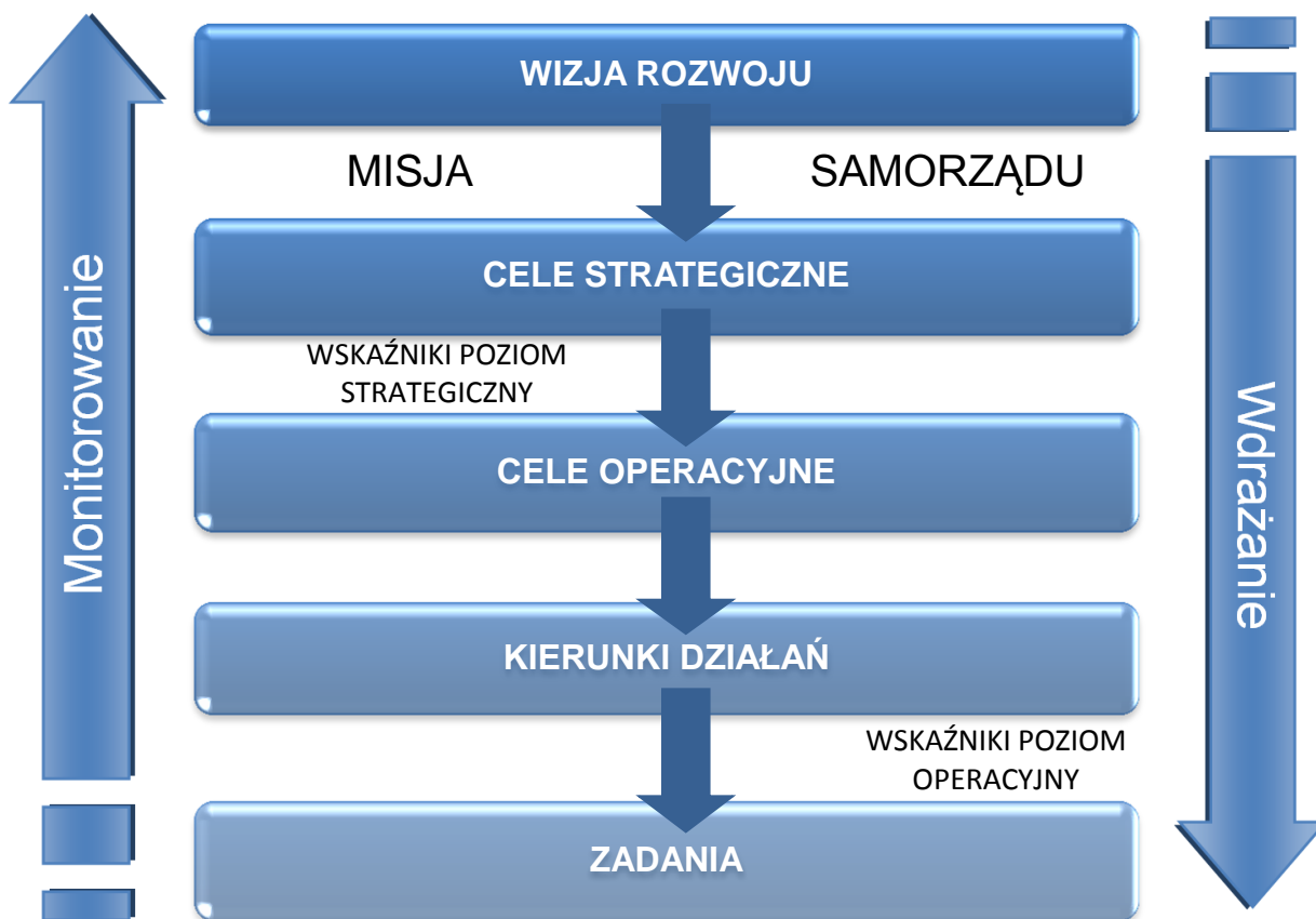
Rysunek 5. Schemat wdrażania i monitorowania Strategii na poziomie strategicznym i operacyjnym

Monitorowanie realizacji Strategii Rozwoju Gminy Wilkołaz na lata 2015-2022 odbywać się będzie na poziomie strategicznym i operacyjnym.