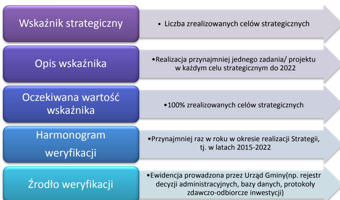
Rysunek 6. Schemat monitorowania wdrażania Strategii na poziomie strategicznym

Zapisy Strategii zostały opracowane w warunkach społecznych, ekonomicznych i politycznych, które są stanami dynamicznymi. Ewaluacja na poziomie strategicznym obejmować będzie systematyczne obserwowanie zmian wewnętrznych i zewnętrznych uwarunkowań rozwoju Gminy Wilkołaz, procesów zachodzących w otoczeniu oraz aktualizowaniu celów i kierunków działania. Monitorowanie wdrażania dokumentu strategii na poziomie strategicznym przedstawia poniższa schemat: