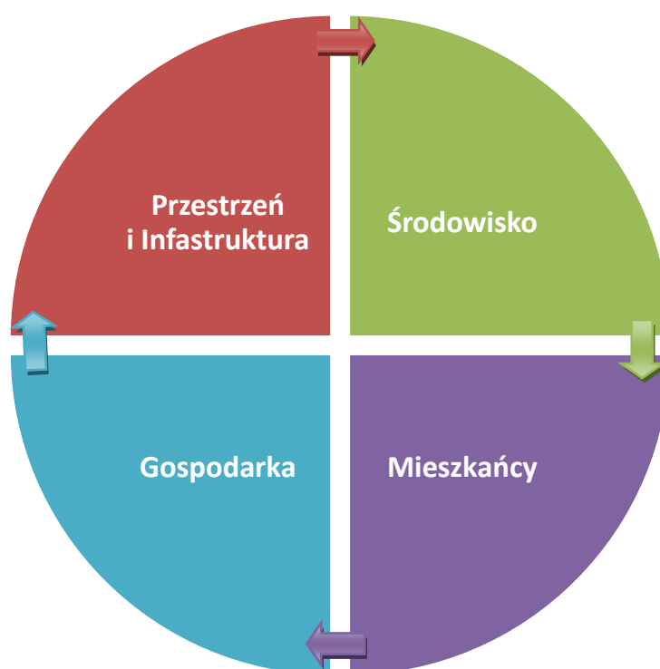
Rysunek 2. Obszary priorytetowe Strategii Rozwoju Gminy Wilkołaz

Diagnoza społeczno-gospodarcza stanu obecnego Gminy Wilkołaz przeprowadzona w II części strategii, wyniki przeprowadzonych konsultacji społecznych oraz sporządzona na tej podstawie analiza SWOT pozwoliły na wyznaczenie celów strategicznych, do realizacji których dążyć będzie w swoich działaniach Gmina Wilkołaz, aby urzeczywistnić określoną wyżej wizję.