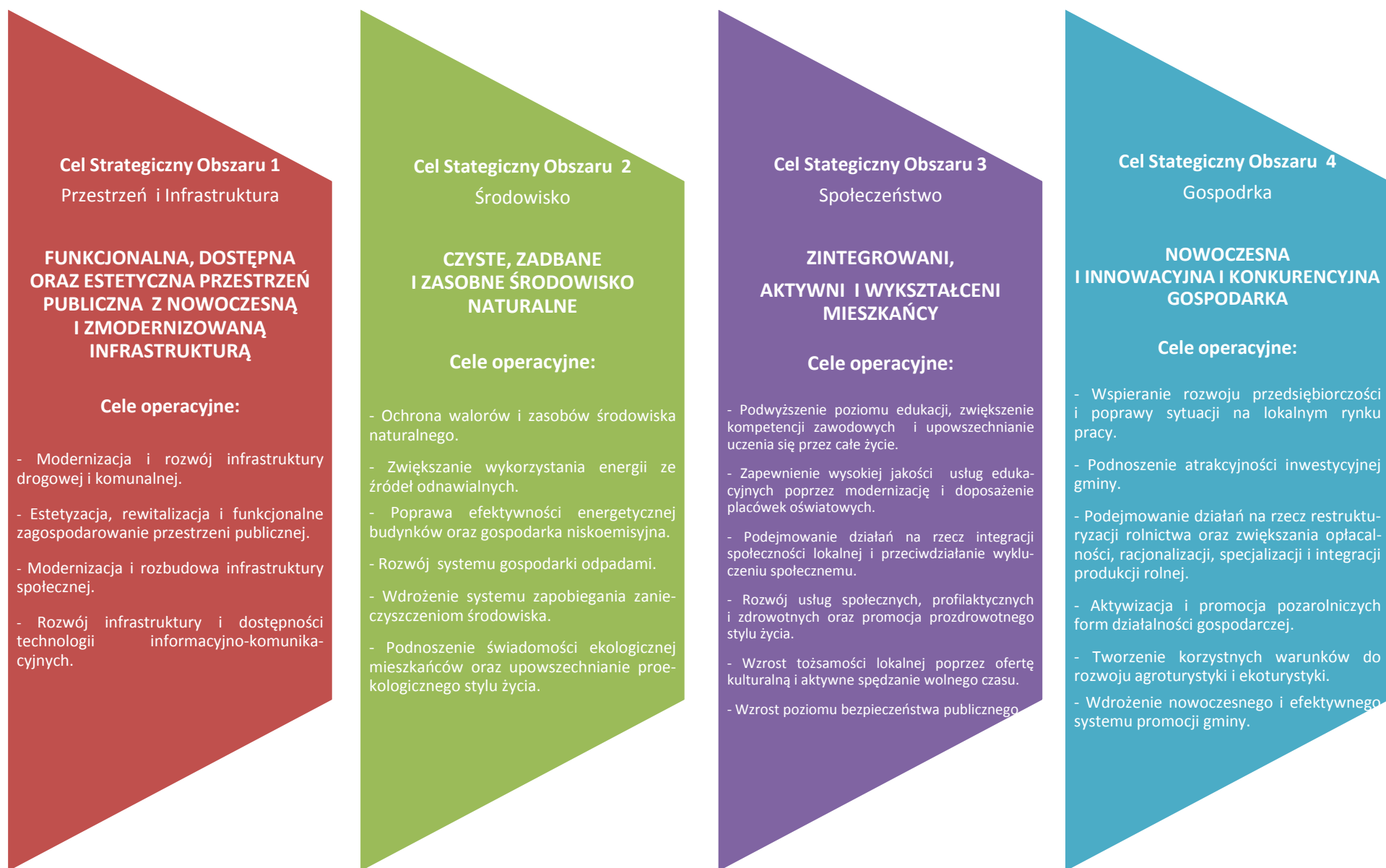
Rysunek 3. Schemat prezentujący strukturę celów strategicznych, celów operacyjnych i kierunków działań Strategii Rozwoju Gminy Wilkołaz