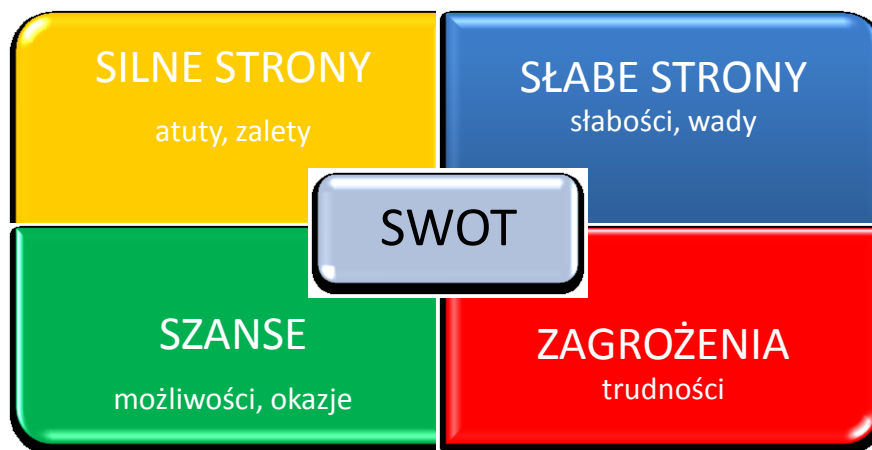
Rysunek 1. Schematyczne przedstawienie analizy SWOT

Jej nazwa pochodzi od akronimów angielskich słów Strengths (mocne strony), Weaknesses (słabe strony), Opportunities (szanse) i Threats (zagrożenia). Polega ona na zidentyfikowaniu wymienionych wyżej czterech grup czynników, dzięki czemu można je odpowiednio wykorzystać w procesie zaplanowanego rozwoju lub zniwelować skutki ich negatywnego wpływu. Dzięki tej metodzie można również pogrupować czynniki na pozytywne (mocne strony i szanse) oraz negatywne (słabe strony i zagrożenia). Często dzieli się je również na czynniki wewnętrzne (opisujące mocne i słabe strony danej jednostki) oraz czynniki zewnętrzne (czyli szanse i zagrożenia wynikające z jej mikro- i makrootoczenia). Czynniki wewnętrzne (mocne i słabe strony) są zależne m.in. od władz lokalnych i lokalnej społeczności, natomiast czynniki zewnętrzne (szanse i zagrożenia) należące do otoczenia bliższego i dalszego są niezależne od władz danej jednostki, a także jej mieszkańców.