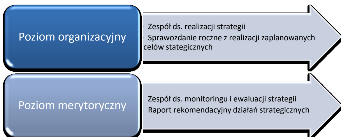
Rysunek 4. Najważniejsze poziomy wdrażania Strategii

Wdrożenie Strategii podzielone na poziomy zaprezentowane na poniższym rysunku: