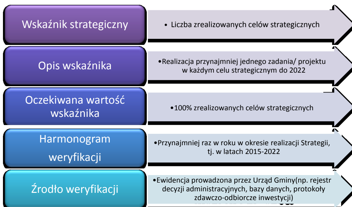
Rysunek 6. Schemat monitorowania wdrażania Strategii na poziomie strategicznym

Zapisy Strategii zostały opracowane w warunkach społecznych, ekonomicznych i politycznych, które są stanami dynamicznymi. Ewaluacja na poziomie strategicznym obejmować będzie systematyczne obserwowanie zmian wewnętrznych i zewnętrznych uwarunkowań rozwoju Gminy Wilkołaz, procesów zachodzących w otoczeniu oraz aktualizowaniu celów i kierunków działania. Monitorowanie wdrażania dokumentu strategii na poziomie strategicznym przedstawia poniższa schemat: